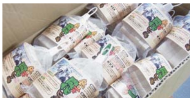
▲梱包された間伐ヒノキ

活動内容が評価され、毎日新聞、日本経済新聞にも間伐ヒノキを取り上げて頂きました。